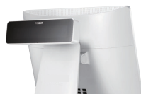
Display Cliente • VFD (2 Linee x 20 Caratteri)