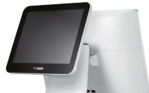
Secondo Display • 9.7", 15" LCD